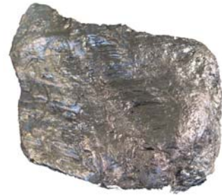
Nahezu reiner Kohlenstoff aus Ceylon