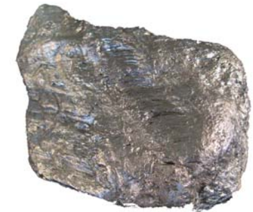
Nahezu reiner Kohlenstoff aus Ceylon